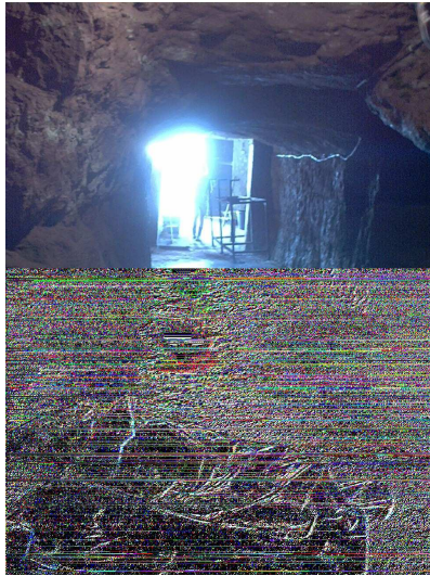
Abb. 1: Vom Keller in Richtung Mundloch fotografiert